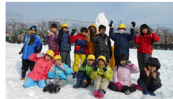
それぞれの塔の前で記念撮影