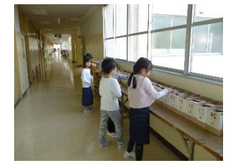
ご協力ありがとうございます。