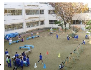
<中庭で遊ぶ子供たち>